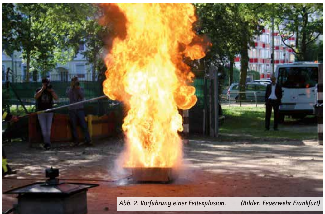
Abb. 2: Vorführung einer Fettexplosion. (Bilder: Feuerwehr Frankfurt)

Mittlerweile sind der Deutsche Feuerwehrverband, die Werkfeuerwehren und die Berufsfeuerwehren von dem neuen Konzept der Erstbrandbekämpfung überzeugt. Bei Tests mit verschiedenen Feuerlöschern stellte sich heraus, dass bei Bränden in Räumen grundsätzlich nur eine Löschmitteleinheit (LE) im Sinne der ASR A 2.2 erforderlich ist, da nur bis zu dieser Größenordnung eines Brandes der Aufenthalt ohne Eigengefähr-